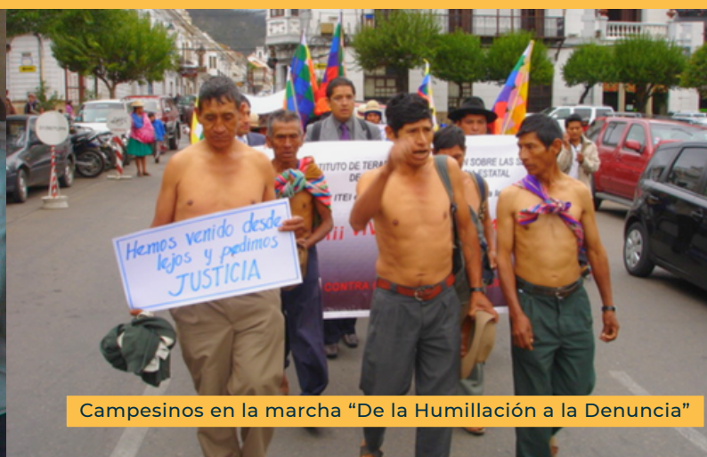
Campeñinos en la marcha “De la Humillación a la Denuncia”