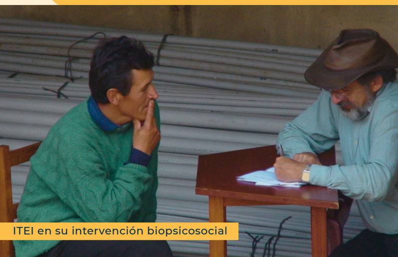
ITEI en su intervención biopsicosocial

Estos testimonios son parte del libro “De la Humillación a la denuncia” (2012) publicado por el ITEI y que pueden descargar de forma gratuita en el siguiente enlace: https://itei.org.bo/archivos/18234