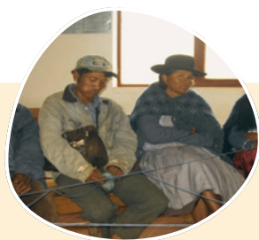
Testimonios de víctimas del 24 de mayo de 2008

Aunque la economía boliviana es predominantemente informal, si se toma como base el salario mínimo nacional (2025) , Bs. 2'750 (US$ 395 al cambio de Bs. 6.96), se estima que la pérdida de productividad puede ascender a: